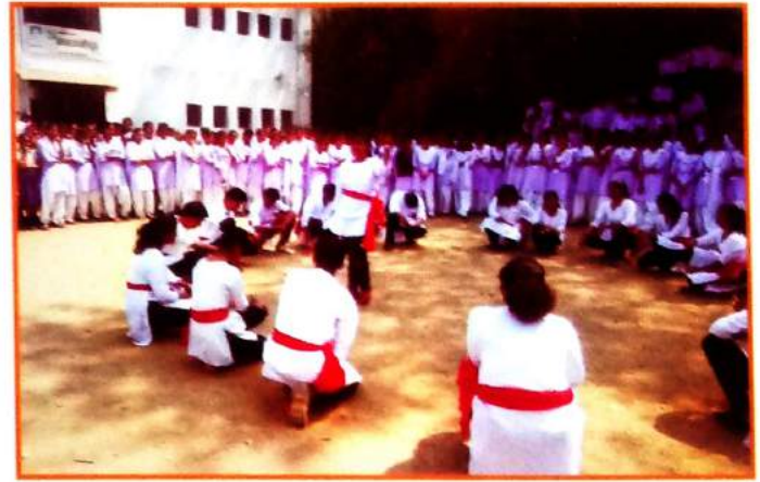
पथनाट्याद्वारे सामाजिक प्रबोधन