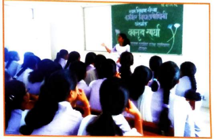
विविध कला गुणांना वाव