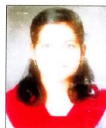
प्रतिक्षा कदम PCB-110, PCM-108