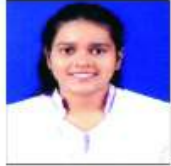
समुध्दी पाटें 90.17%