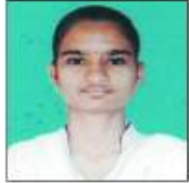
समिधा काटकर 91.17%