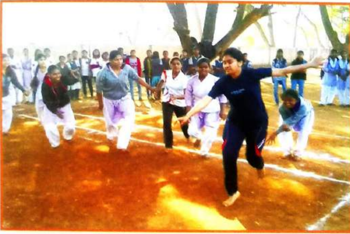
क्रीडा स्पर्धेतील सहभाग