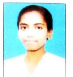
विद्या कणसे PCB-115, PCM-110