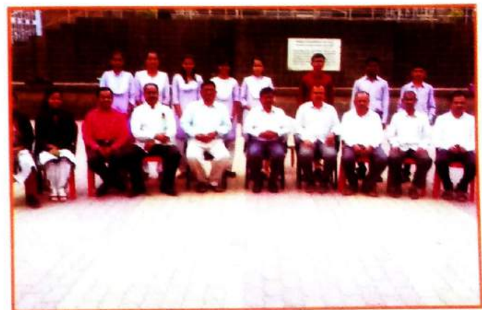
गुणवंत विद्यार्थ्यांसमवेत शिक्षक व पदाधिकारी