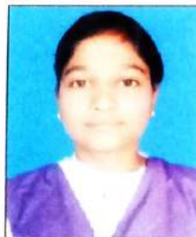
प्राजवता फाळके PCM-106